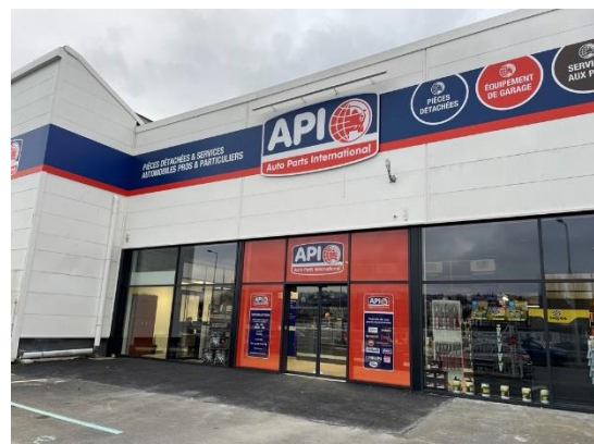
API au Havre