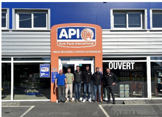
API à Hérouville-Saint-Clair à côté de Caen